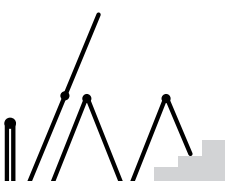
Quatro posições de uso.