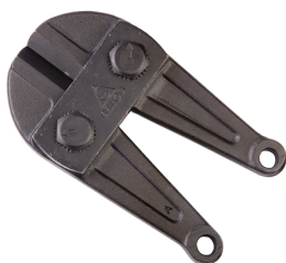
C 6009-900 Cabeça Corta-varões 900 mm / C6009900