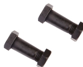
T 6009-900 M Parafuso Cabo Corta-varões 900 mm / T6009900M